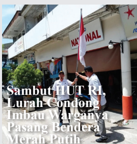
Sambut HUT RI, Lurah Condong Imbau Warganya Pasang Bendera Merah Putih

“Tujuannya untuk menghormati detik-detik proklamasi. Kecuali bagi orang dengan aktivitas yang berpotensi membahayakan diri dan orang lain apabila dihentikan,” ujarnya.